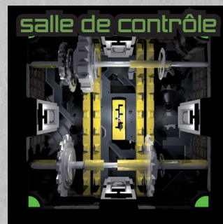
salle de contrôle

Mettez votre personnage sur la salle mobile après l'avoir dévoilée. Puis prenez la salle et votre pion et intervertissez sa position avec une salle cachée n'importe où sur le plateau. Cette dernière salle reste cachée. Si toutes les salles sont déjà révélées, cette salle n'a aucun effet.