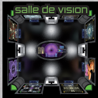
salle de vision

Prenez votre figurine et placez-la sur la salle de départ.