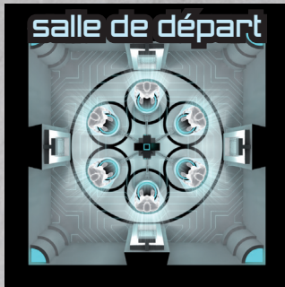
salle de départ

Les salles suivent un code couleur : vert = sans danger / jaune = obstacle / rouge = danger mortel